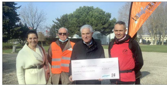
Un chèque au bénéfice des petits malades.

Le défi de ce 15 janvier était de partir d'Ambarès-et-Lagrave et de traverser pendant 63 km des communes de la métropole jusqu'à l'hôpital des enfants à Bordeaux. La course repartait le lendemain de Bordeaux pour revenir, après 53 km, à Ambarès-et-Lagrave.