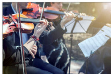
Tous les instruments seront à l'honneur.