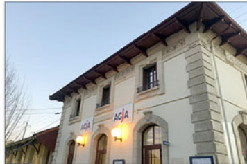
La gare, dont une partie vient d'être réhabilitée, accueille 5 nouvelles sections.